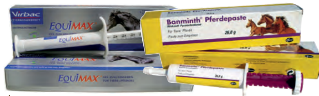
Unterschiedliche Wirkstoffe gegen verschiedene Wurmartensind im Handel. Der Tierarzt sollte den richtigen auswählen.

Es ist also höchste Zeit, das bisherige Vorgehen bei der Wurmbekämpfung zu ändern mit dem Ziel, die Resistenzentwicklung zu verzögern und aufzuhalten. Eine Methode dazu ist – ver-