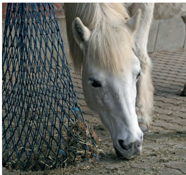
Wird konsequent die Entwicklung der Endoparasiten durch gute Hygienemaßnahmen unterbrochen, kann keine Reinfektion erfolgen.