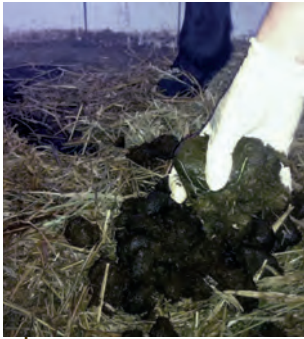
Kotprobennahme aus einem frischen Äppelhaufen.