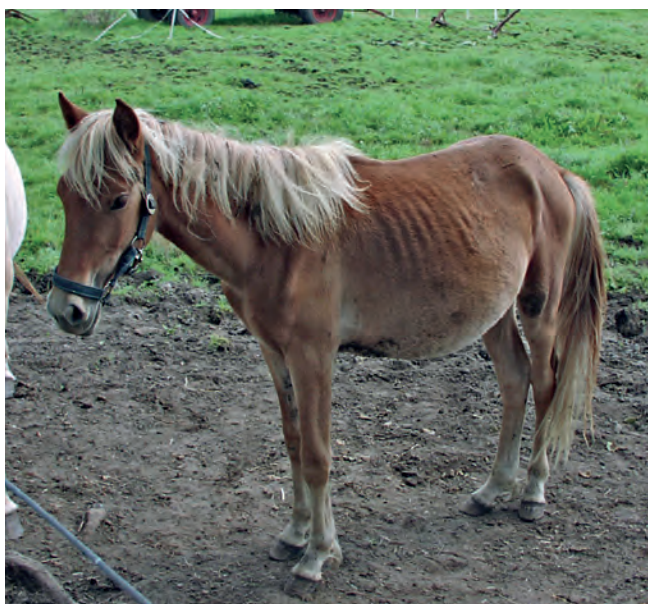
Ein Fall für den Tierschutz: Fohlen können aufgrund starker Verwurmung sogar verenden.

Hier setzen nun die Überlegungen für eine neue, nachhaltige, gezielte und langfristige Parasitenüberwachung bei Pferden an. Diese hat zum Ziel, massive Wurminfektionen zu verhindern und dabei durch einen geringen Wurmbefall das pferdeigene Immunsystem zu stimulieren. Gleichzeitig wird durch einen gezielten, im Ausmaß reduzierten und auf seine Wirksamkeit hin überprüften Arzneimittel Einsatz die Resistenzentwicklung verzögert. Mit dieser Prämisse wird in Dänemark schon seit über zehn Jahren die selektive Entwurmung angewendet. ►►