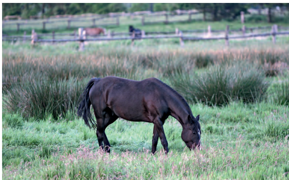
Auf feuchten Weiden finden einige Endoparasiten besonders gute Bedingungen vor, etwa Bandwürmer, die als Zwischenwirt die Moosmilbe brauchen, ebenso wie Leberegel.

Scheidet ein hoher Ausscheider weiterhin mehr als 200 EpG (Strongylideneier) aus, so wird er weiter kontinuierlich entwurmt. Im Hochsommer sollte 14 bis 21 Tage nach der Entwurmung eine weitere Kotprobe untersucht werden. So wird überprüft, ob sich gegen das verwendete Präparat eine Resistenz entwickelt. ▶▶