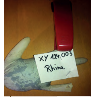
Dann noch sachgerecht verpacken.